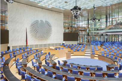
World Conference Center Bonn